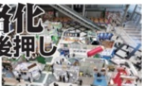
「食品開発展」「健康博覧会」でNMN素材の出品が目立った

ある販売メーカー担当者は「長寿遺伝子」「若返り成分」などをキャッチコピーにNMNのサプリメントが増えているが、どう体感してもらおうかが悩ましいところ。他の健康機器に対するエビデンスのデータ蓄積にも期待したい」と話す。エビデンスに関しては、長寿遺伝子を活性化させる働きのほか、最近では、大阪大学医学部の研究グループが「身体的フレイルを伴う糖尿病患者に対するNMNの効果」に関する研究を行っている。